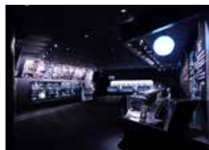
小型のクラゲを顕微鏡やルーペで観察できる「マイクロアクアリウム」

2026年4月にクラゲ展示エリアを拡張リニューアル、100種のクラゲを展示する世界一のクラゲ水族館。クラゲ展示室「クラゲドリームシアター」には様々なクラゲがゆったりと泳ぎ、格別の癒し空間となっています。直径5mのクラゲ大水槽「クラゲドリームシアター」は必見。地元庄内の海や川の生き物や、アシカ・アザラシも見られます。