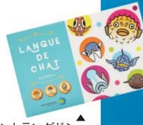
▲プリントラングドシャ