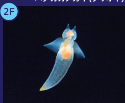
親潮アイスボックス 小さいけれどユニークで色鮮やかな生き物たちを宝石箱のような水槽でご紹介します。