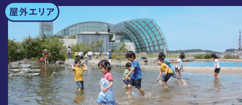
蛇の目ビーチ 磯、干潟、浜という海辺の自然を再現した広さ4,500㎡の世界最大級のタッチプールです。