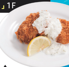
▲ヘミングウェイのカジキメンチ