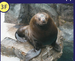
北の海 ゴマフアザラシやトドなどの大型のほ乳類と海鳥を展示しています。迫力のフィーディングタイムは必見!