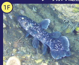
海・生命の進化 現在まで生き残る水の中の「生きた化石」や、世界初の「シーラカンス幼魚」の映像を展示しています。