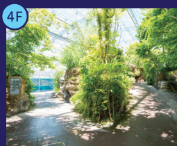
ふくしまの川と沿岸 福島県内の川の上流域から海岸までの生き物が見られます。自然光を取り入れ、植物も展示しています。