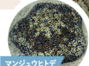
マンジュウヒトデ