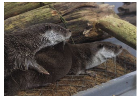
大人気のユーラシアカワウソの親子

キタノアカヒレタビラなど福島県に生息する貴重な淡水魚や水生昆虫をはじめ、ユーラシアカワウソなど、約170種4000点を展示しています。小さな箱型水槽がずらりと並び、カエルやゲンゴロウなどを間近で見られる「おもしろ箱水族館」や、小川を再現したタッチプールが子供たちに人気です。また季節に応じて様々な体験型の企画展が満載です。