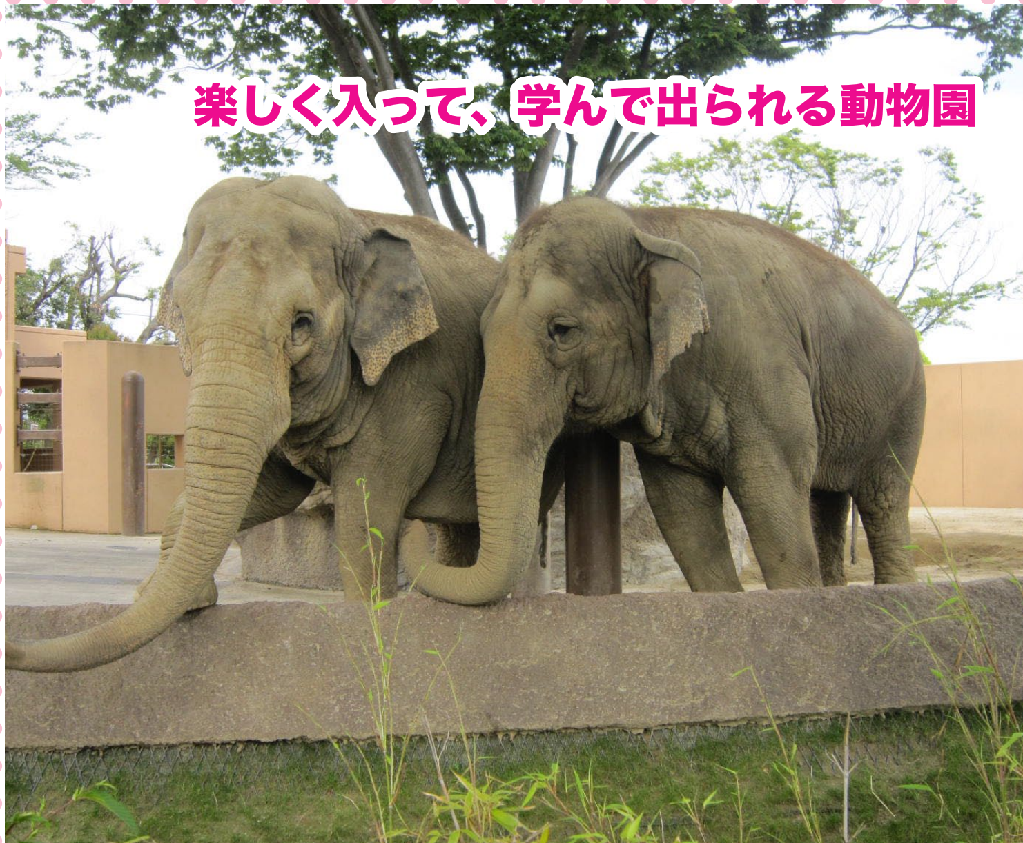
動物園に入ると2頭のアジアゾウがお出迎え