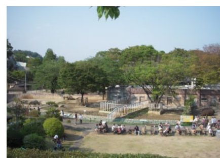
アフリカをイメージしたエリアではカバやクロサイなどの草食獣がのびのびと暮らしています

太平洋を望む緑に囲まれた園内は、ゾウやキリン、ライオンなどの大型獣からチンパンジーを始めとする霊長類やカピバラ、レッサーパンダまで約100種540点の動物たちであふれています。四季折々のイベントや小動物とのふれあい、エサやり体験も充実。2018年秋には新しく「はちゅうるい館」もオープンしました。