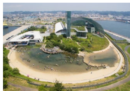
海辺の自然を再現した「蛇の目ビーチ」と淡水のビオトープ「BIOBIO かつばの里」

寒流の親潮と暖流の黒潮がであう、福島県沖の「潮目の海」をテーマにした水族館です。太陽光が降り注ぐ館内では、植物も展示し、生き物が生息する環境を丸ごと再現しています。裸足になって生き物と触れ合える世界最大級のタッチプール「蛇の目 じゃ ビーチ」もあり、様々な体験ができるのも魅力です。