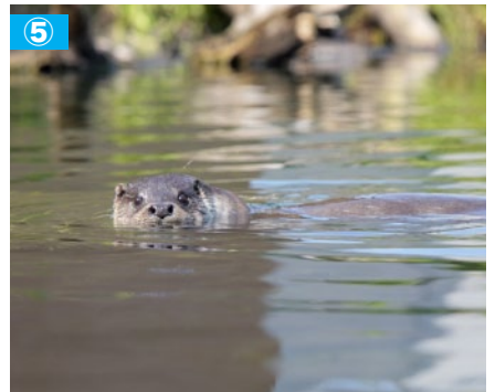
③ アクアマリンで一番大きなトドのイチロー。エサの時間の前は、イチローの大きな声が外まで響き渡ります。④ パンダのような模様のクラカケアザラシを展示しているのは当館だけ。暑さが苦手なため秋～春の限定展示。⑤ ユーラシアカワウソは夜行性のため普段は寝てばかりいますが、エサの時間は元気に泳ぐ姿が見られます。