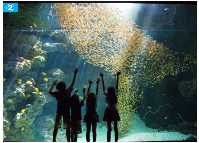
① ふくしまの川と沿岸コーナーでは、福島県内の川の上流域から海岸までを、自然光を取り入れた環境下で植物とともに展示しています。② サンゴ礁の海コーナーは、美しく群れをなすキンメドモドキや、砂の中から顔を出すチンアナゴなどを展示しています。アクアマリンふくしまでも特に人気の水槽です。