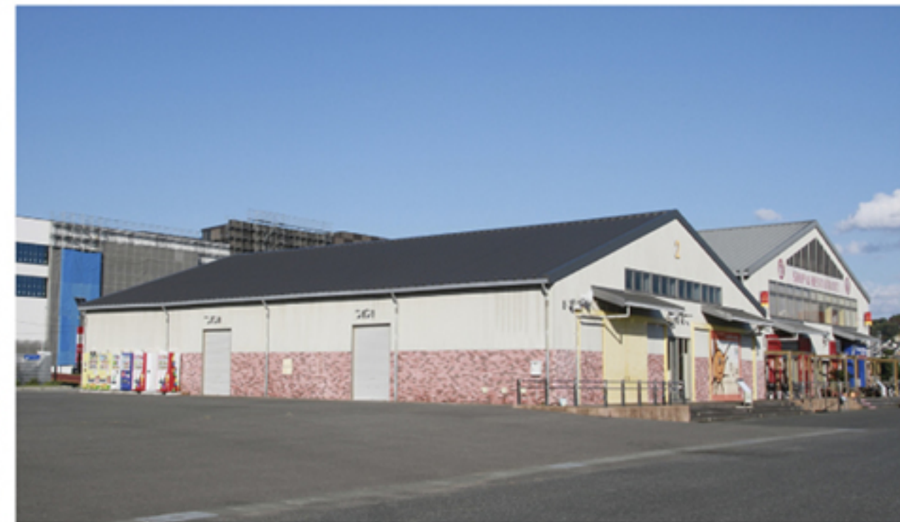
展示会場：潮目交流館