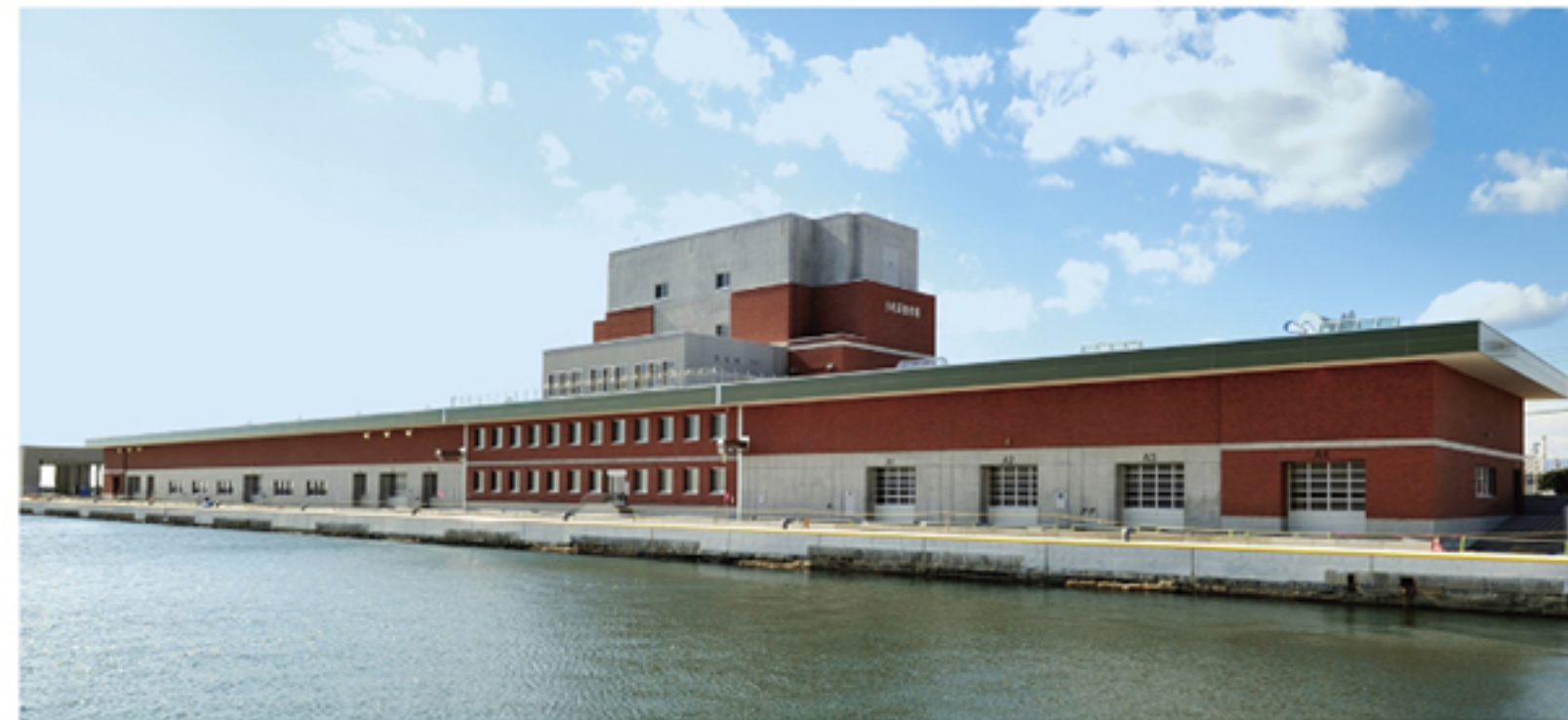
本会議場：小名浜魚市場