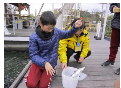
命の授業 調理体験