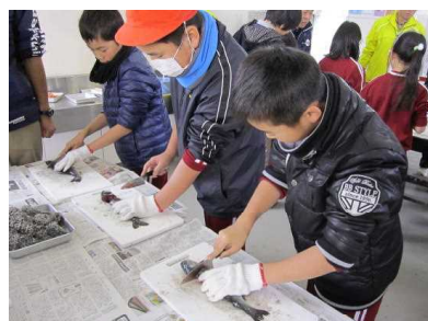
釣り堀で釣り体験