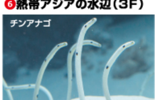
⑥ 熱帯アジアの水辺(3F)